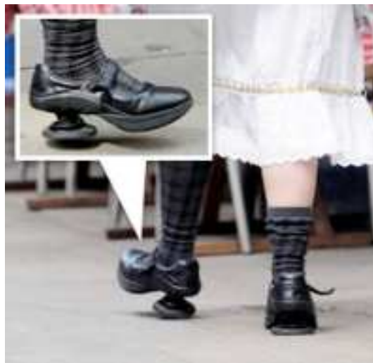
Moon Bounce Shoes