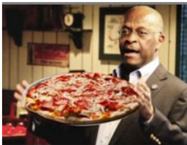
Herman Cain: Chef von Godfather's Pizza

Dann gab es bis vor kurzem Herman Cain, Pizzakönig, dem urplötzlich alle Herzen zuzufiegen schienen, bis sich herausstellte, dass er weiblichen Angestellten mehr als freundschaftlich nahe trat, abgesehen davon, dass er einen der seltsamsten Steuerreformpläne vertrat, von sich selbst nur in der dritten Person redete und das von seinem Personal ebenfalls verlangte. Die Ironie des Namens seiner Firma ist garantiert unfreiwillig. Wer erinnert sich nicht an Marlon Brandos Glanzrolle? Andererseits beweist das vielleicht wieder, dass Amerika doch ein Schmelztiegel ist.