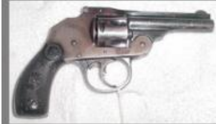
William McKinley 1901