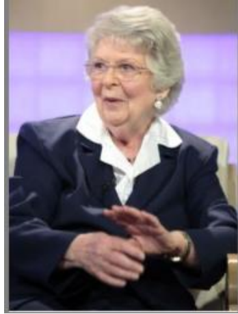
Sara Jane Moore 2009

damals auf den Auslöser drückte, und wenn man sie heute in Talkshows sieht, traut man es ihr kaum zu. Sie sei froh, sagt sie jetzt, dass ihr Schuss danebenging.