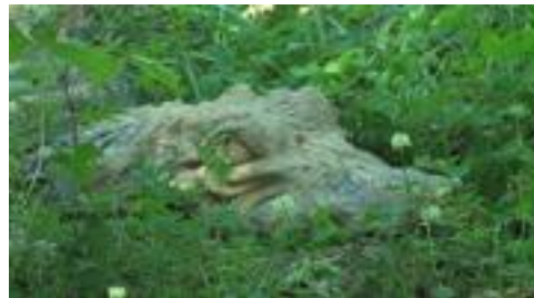
Das gefährliche Gartenornament

Fassungslos hingegen ist man, wenn man in der Zeitung liest, dass am 20. April 2011 in Houston (Texas) ein sechsjähriger Junge einen geladenen Revolver mit zur Schule brachte. Zum Glück wurden die drei Kinder, die es traf als die Waffe unbeabsichtigt losging, nur leicht verletzt. Und was dachten bloß die Polizisten, die am 2. Juni in Kansas City (Missouri) - unter jeglicher Missachtung geografischer und zoologischer Tatsachen - auf einen Alligator losballerten?