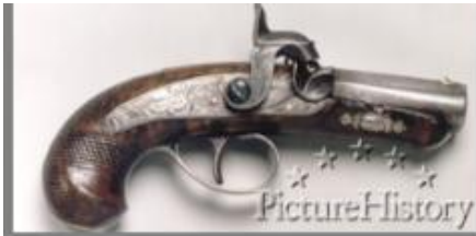
Abraham Lincoln 1865

Es ist bereits länger her, seit ich mich gemeldet habe und das Material häuft sich. Aber gehen wir erst einmal einen kurzen Schritt zurück. Nein, überrascht war ich eigentlich nicht, als ich am 9. Jänner 2011 die New York Times aufschlug und von dem Attentat auf die Abgeordnete Gabrielle Giffords erfuhr. Dass Politiker hier er- oder angeschossen werden, hat Tradition.