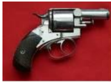
James Garfield 1881