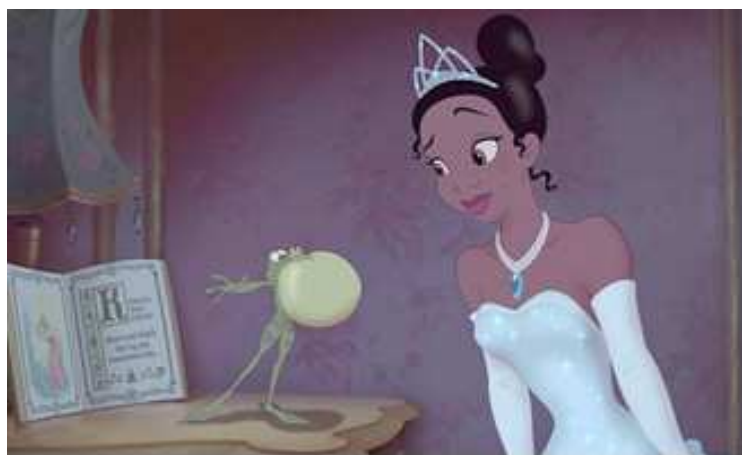
Disney Studios: The Princess and the Frog (2009)

Damit stellt sich die First Lady als Image und Fürsprecherin in einer Person zur Verfügung, denn mit dem herkömmlichen Image der afro-amerikanischen Frau tut man sich immer noch schwer. Man kann sich nicht so richtig entscheiden.