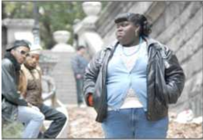
Der Film Precious (2009)

Eine prominente Stimme, um einem Gesundheitsproblem zu Leibe zu rücken, das nicht zum Lachen ist, ist daher durchaus angesagt. Seit 1980 hat sich das Übergewicht bei Kindern landesweit verdreifacht. Die 6-11 jährigen kommen von damals 6,5 % nun auf 19,6 %, die 12-19 jährigen von 5,0% auf 18,1 %. Nur am Rande sei erwähnt, dass gute Ernährung nicht billig kommt und einen gewissen Zeitaufwand voraussetzt, also häufig klassenspezifisch ist. Es ist kein Geheimnis, dass es die einkommensschwachen Schichten stärker trifft. Mississippi, der ärmste Staat, hat die dicksten Kinder. Es steht nicht gut um die Lebenserwartung vieler dieser jungen Menschen, die bereits im frühen Alter Diabetiker sind.