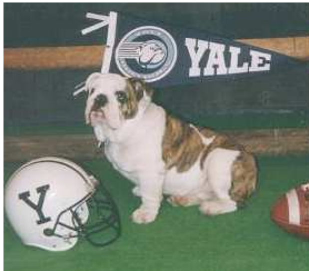
Handsome Dan, der XVII

Die Ivy League ist also doch nicht alles. Den Efeu habe ich schon erklärt. Warum aber League? Ihre Sportteams, ein hochwichtiger Teil des Collegelebens, liegen im Wettbewerb miteinander, und die Spendenfreudigkeit der Alumni steigt oder fällt mit dem Erfolg des Football- oder Hockeyteams - Yale Bulldogs gegen Princeton Tigers!